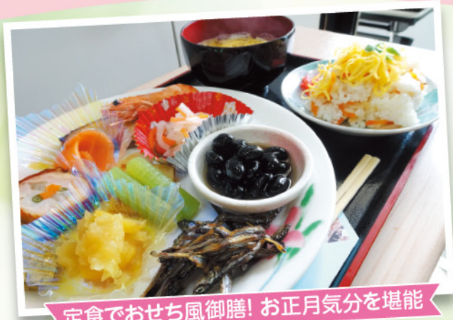
定食でおせち風御膳! お正月気分を堪能