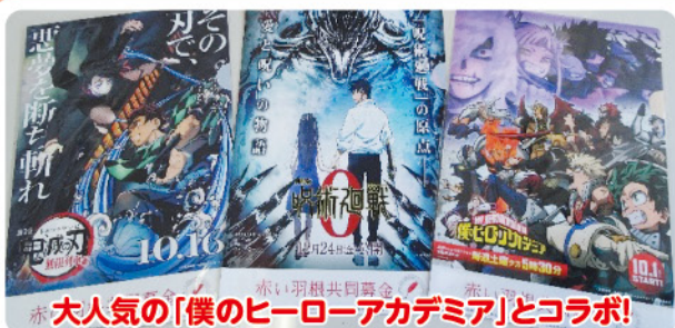
大人気の「僕のヒーローアカデミア」とコラボ!

アニメとコラボしたクリアファイル募金は、3月末まで受付中です!これまでコラボしたアニメのものも選べます。ぜひこの機会に、クリアファイル募金にご協力ください。