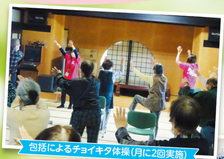
包括によるチョイキタ体操(月に2回実施)