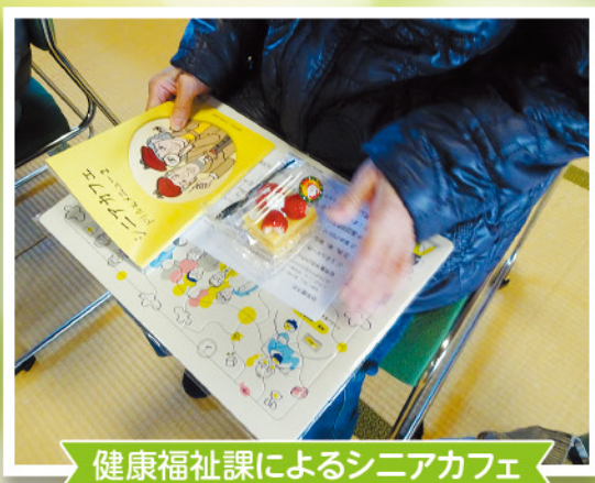
健康福祉課によるシニアカフェ