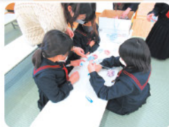
室内での自由遊び