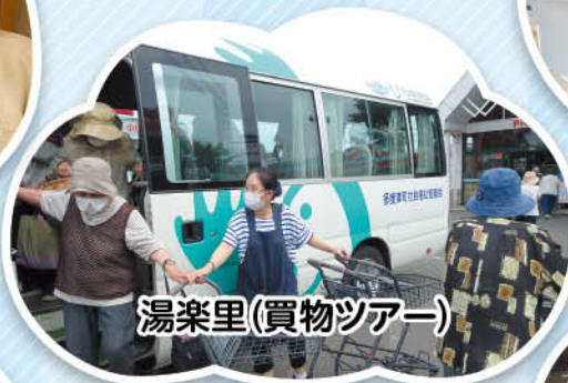
湯楽里(買物ツアー)