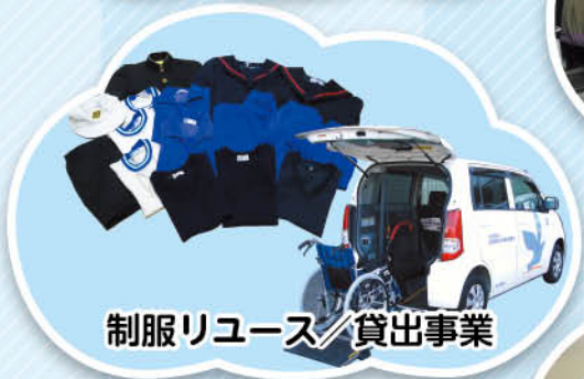
制服リユース／貸出事業