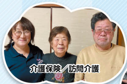
介護保険／訪問介護